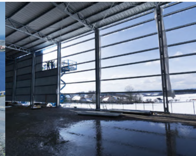
Доставка та монтаж власними ресурсами